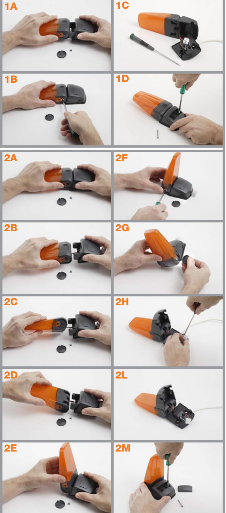
Fig. 1-2 Preparazione installazione: 1) a parete; 2) sulla colonna Preparation for installation: 1) to the wall; 2) on a column Préparation montage: 1) au mur; 2) sur pilier Vorbereitung: 1) Wandinstallation; 2) Installation auf Pfeiler Preparación Instalación: 1) de pared; 2) en el pilar